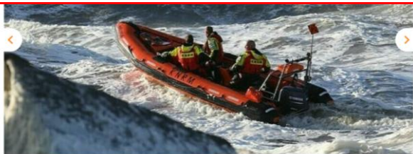
NIEUWE REDDINGBOOT (INCLUSIEF BOOTLIFT)