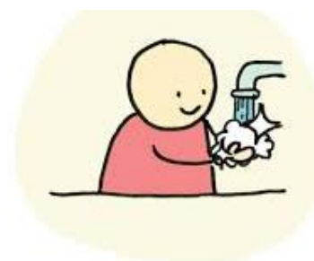
was je handen vaak met zeep